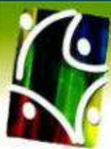
Imagen del Congreso