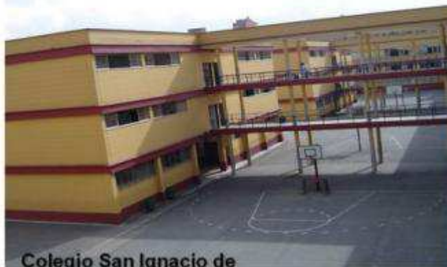
Colegio San Ignacio de Loyola

El Congreso será del 14 al 18 de Agosto de 2013.